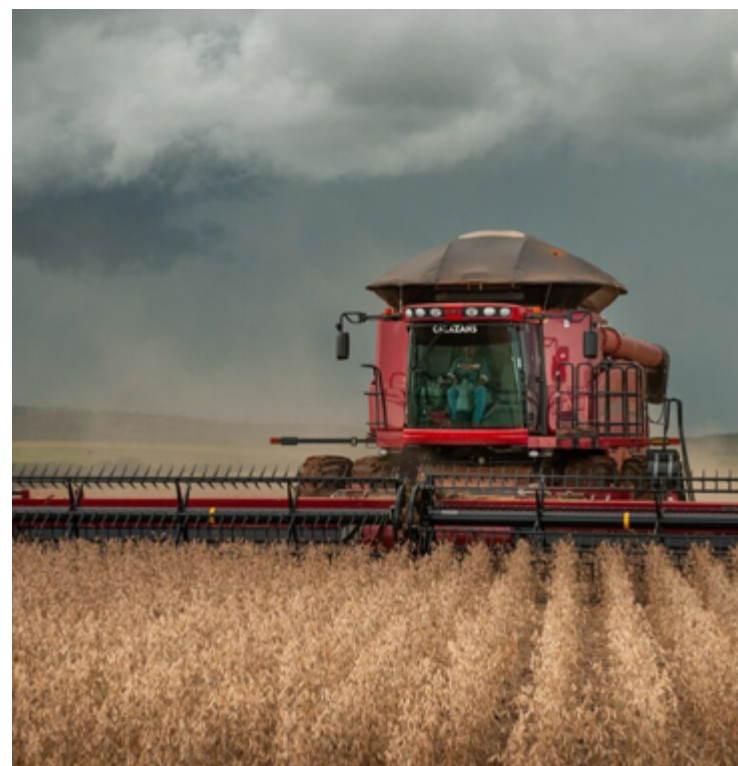
Pesquisa do CLP avalia indicadores como o Produto Interno Bruto e o crescimento potencial da força de trabalho nos próximos anos

O ranking completo pode ser acessado no site: ranking-decompetitividade.org.br .