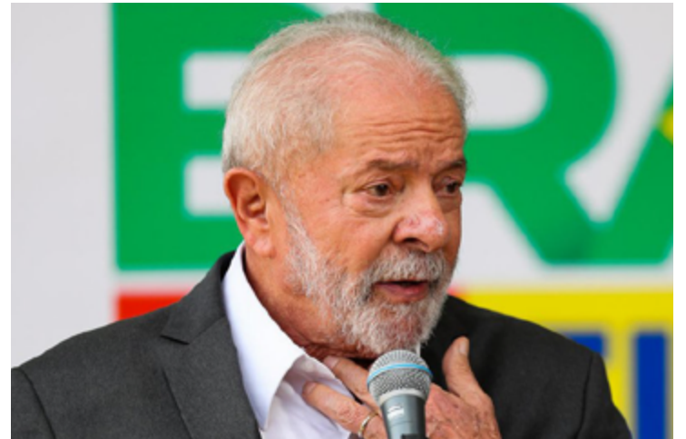
Lula da Silva: primeira visita a Goiás no atual governo

O governador Ronaldo Caiado (União Brasil) não estará presente na ocasião por estar em viagem à Israel.