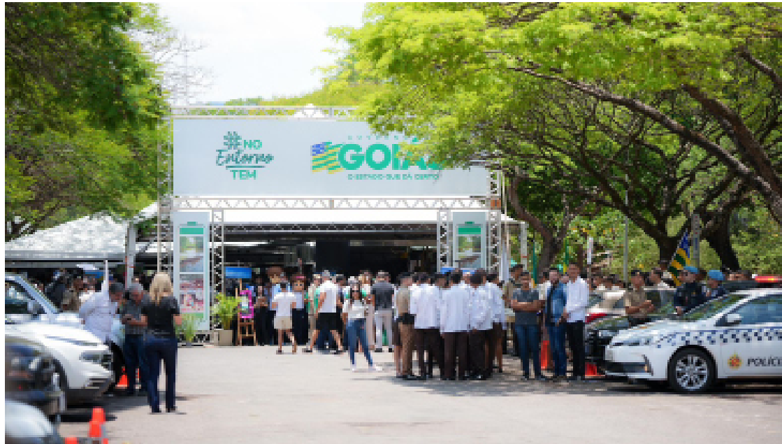
Entrada da 1ª Feira #NoEntornoTem, no Parque da Cidade, em Brasília, em outubro de 2023

Na primeira edição, em outubro de 2023, as treze cidades participantes – Abadiânia, Alexânia, Águas Lindas, Cidade Ocidental, Cocalzinho, Cristalina, Formosa, Luziânia, Novo Gama, Padre Bernardo, Planaltina de Goiás, Santo Antônio do Descoberto e Valparaíso – mostraram opções de turismo e gastronomia. Cada município, conforme sua especificidade, mostrou produtos e roteiros próprios. Por exemplo, Cocalzinho de Goiás levou à Feira a Rota de Queijos e Vinhos. Já Ci-