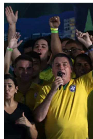
Jair Bolsonaro espera julgamento “justo, isento”

Os militares colocam Bolsonaro no centro da trama golpista. Segundo os depoimentos, o presidente não só sabia das minutas para impedir a posse de Lula como as discutiu com os chefes das Forças Armadas em reuniões no Palácio da Alvorada.