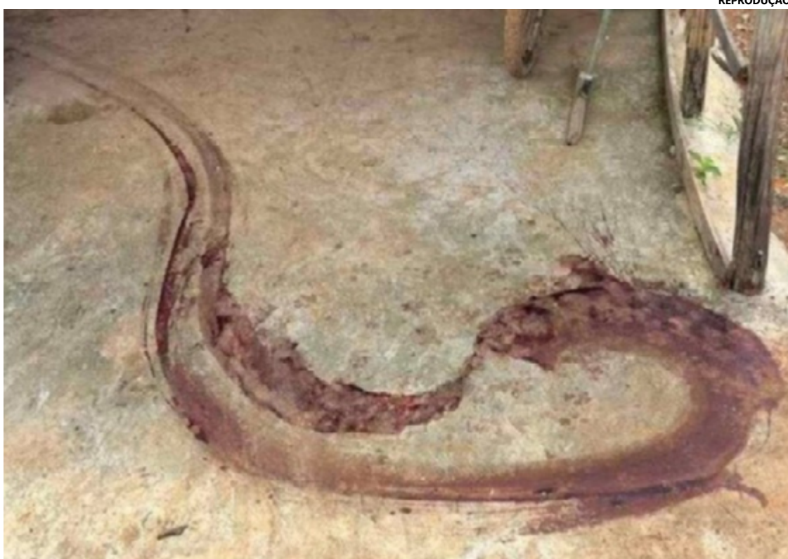
Abatedouro clandestino, para onde os porcos eram levados

Além do suspeito, a mulher responsável por receber os suínos furtados também será alvo de investigações, sendo acusada de receptação. As autoridades asseguram que todas as medidas cabíveis estão sendo tomadas para garantir a conclusão eficaz das investigações e o devido encaminhamento judicial dos envolvidos.