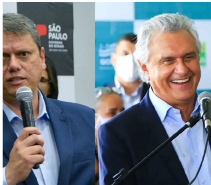
Tarcísio de Freitas e Ronaldo Caiado: viagem a Israel