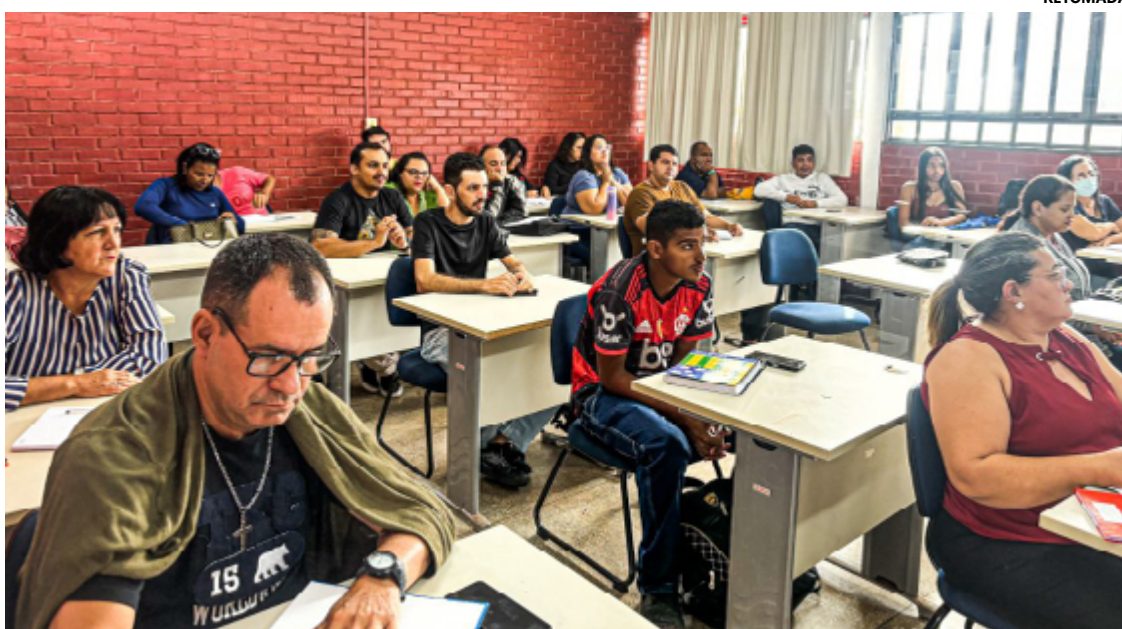
Alunos do Curso de Guia de Turismo do Cotec durante aula presencial: qualificação em alto nível focada nas demandas do mercado