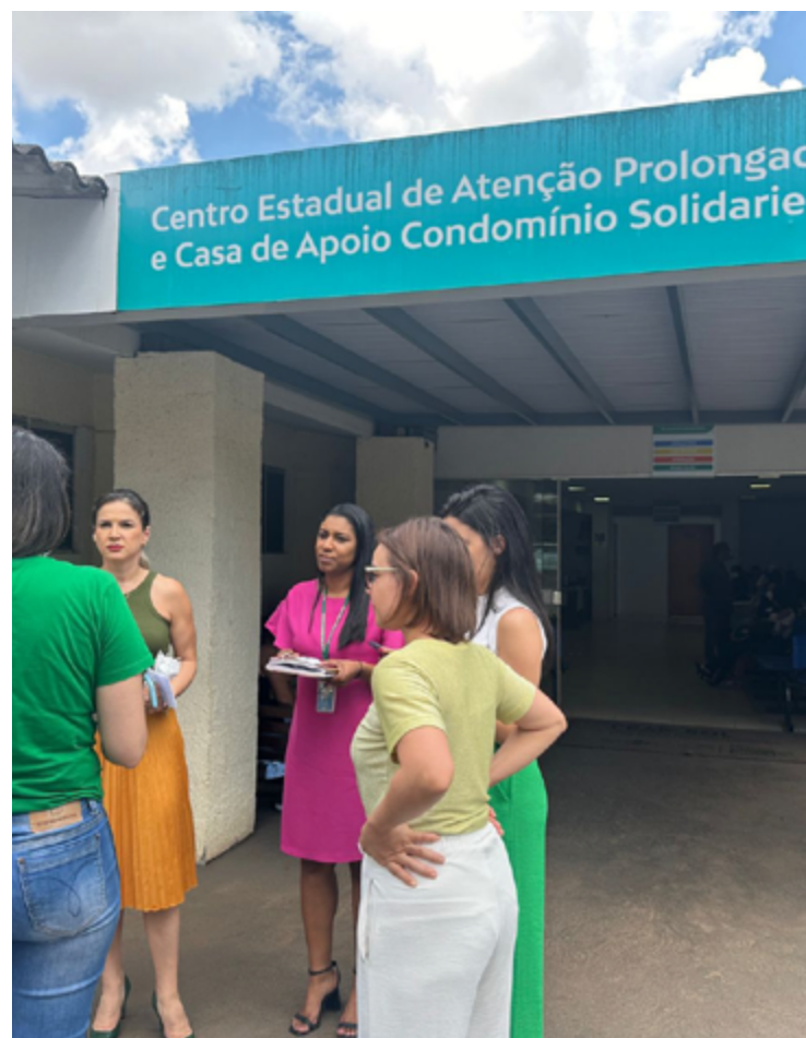
Força tarefa: Ceap-Sol é uma das 15 unidades a receber visitas técnicas